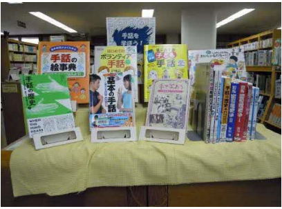
【庄内館】 手話を学ぼう!