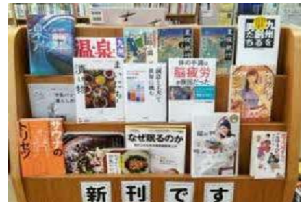
【穎田館】 10月新着本特集