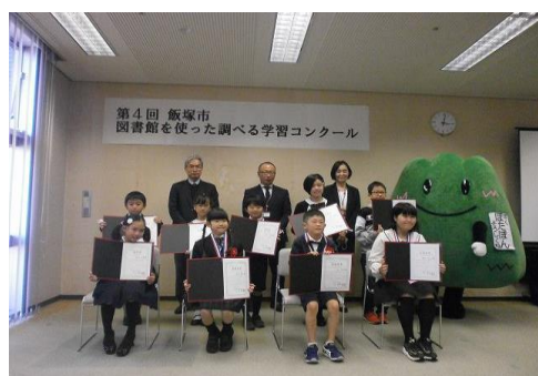
11/7 第4回飯塚市図書館を使った 調べる学習コンクール表彰式 【イヴ コミュニティセンター301・302】