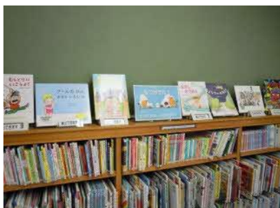
【庄内館】 おとなも読みたい絵本