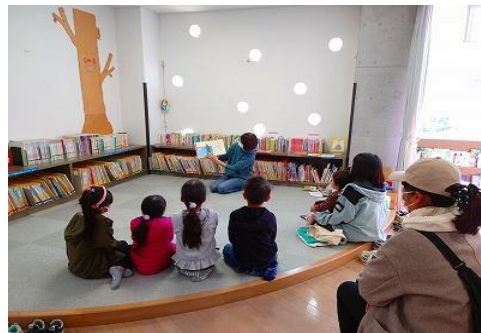
おはなし会【ちくほ図書館】