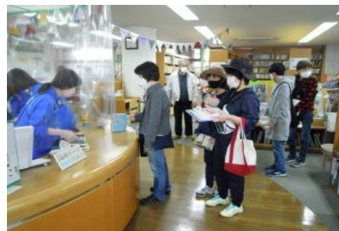
10/22～10/24 庄内図書館まつり 【庄内図書館】