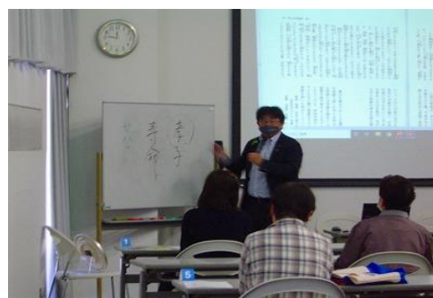
3/3 郷土を学ぼう講座 「おもてなし・健康長寿の道 長崎街道に学ぶ～お茶・お菓子・ 医薬の応接・交流・養生文化～」 【ちくほ図書館】