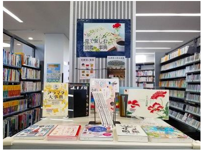
【ちくほ館】 見て楽しむ図鑑・事典