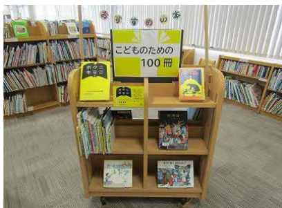
【飯塚館】 こどものための100冊