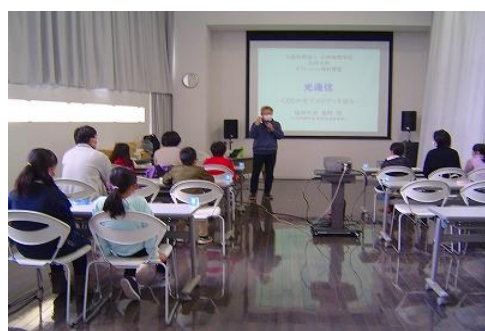
12/26 リフレッシュ理科教室（番外） 【ちくほ図書館】