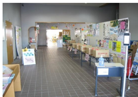
11/27・28 古本市 【穂波図書館】