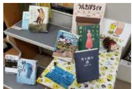
【穎田館】 司書のおすすめ