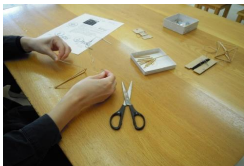
11/17 庄内子育て支援センター協働企画 「ヒンメリをつくる」 【庄内交流センター別館】