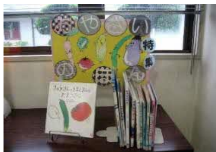
【穂波館】 おやさいのほん