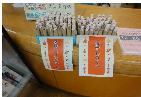
1/5～1/13 本とおみくじ 【庄内図書館】