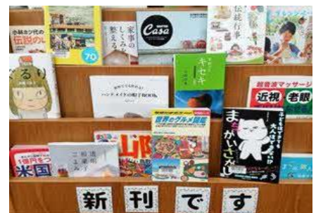
【穎田館】 8月新着本特集