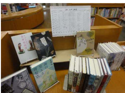
【庄内館】 歴代 芥川賞・直木賞