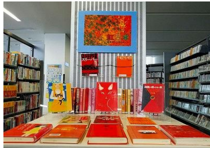
【ちくほ館】 紅葉本 -紅葉色の本集めました-