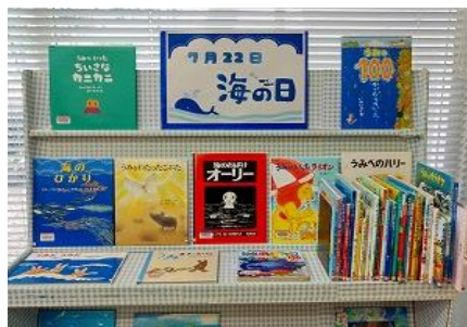
【ちくほ館】 7月22日海の日