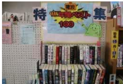
【穂波館】 穂波年間ベスト100