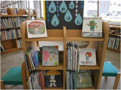
【飯塚館】 あめのえほん