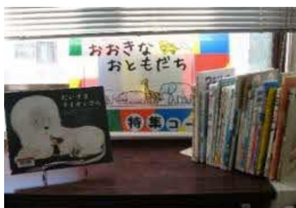
【穂波館】 おおきなおともだち