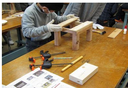
1/10 SDG s 地域課題解決 ソーシャルビジネス事業2021 DIY入門～小さなイス～ 【飯塚図書館】