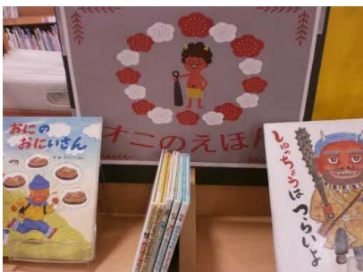
【飯塚館】 オニのえほん