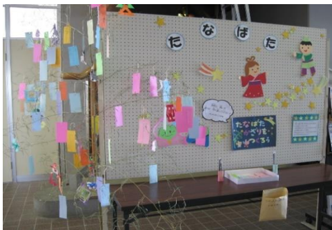
6/25～7/11 七夕まつり 【穂波図書館】