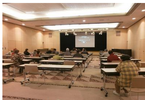
3/6 バリアフリー映画上映会 【イツ コミュニティセンター401】