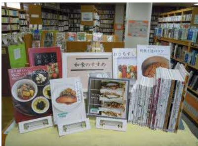
【庄内館】 和食のすすめ