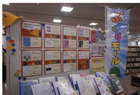
11/19～11/21 ぶっくりモール 【飯塚図書館、イヅカコミュニティセンター、 本町・東町商店街】