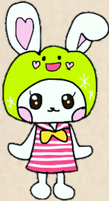
りぶ活teensキャラクター 「ぼたうさ」