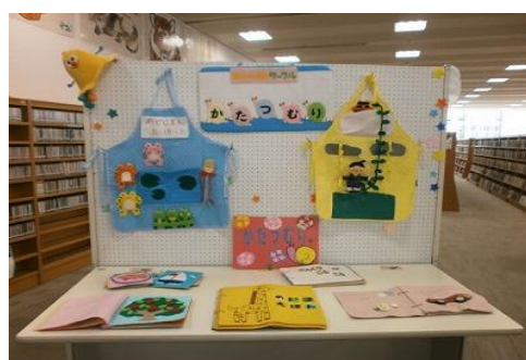
3/6 コミセンまつり ボランティア作品展示 【飯塚図書館】