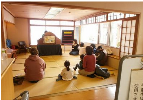
おはなし会【飯塚図書館】