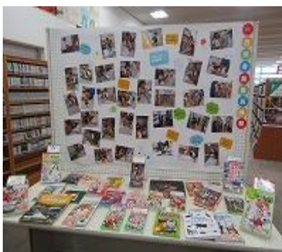
飯塚館 8月 『一日図書館職員おすすめの本』