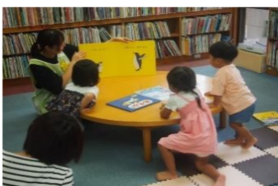
おはなし会【庄内図書館】