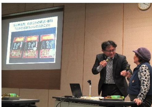
11/28 ふるさと遊学講座 【イツ! カミュニティセンターセミナー室】