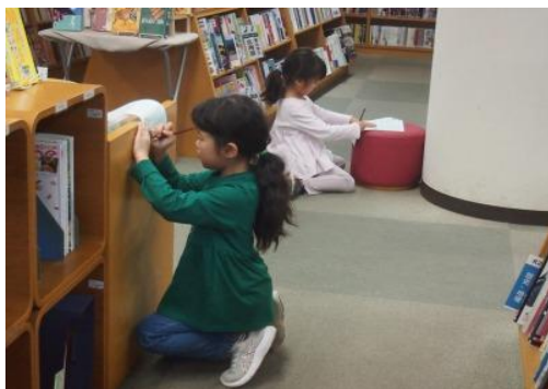
4/19～5/17 子ども読書クイズ大会 【庄内図書館】