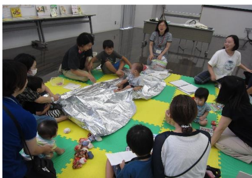
9/11 子育て支援講座①「親子ミニ防災教室」 【ちくほ図書館】