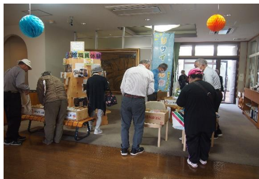
10/25～27 庄内図書館まつり 【庄内図書館】