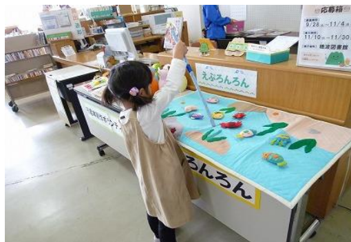
11/8～30 ほなみBOOKカーニバル 【穂波図書館・穂波交流センター】