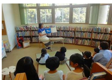
おはなし会【穎田図書館】