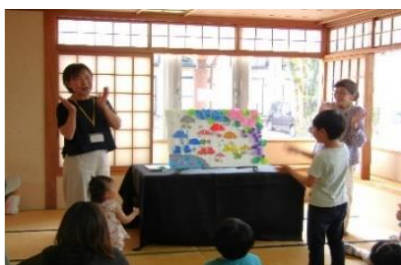
おはなし会【飯塚図書館】