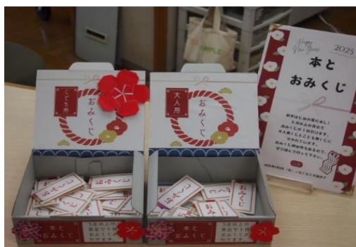
1/5～1/11 本とおみくじ 【庄内図書館】