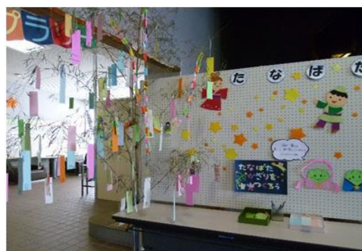
6/22～7/7 七夕まつり 【穂波図書館】