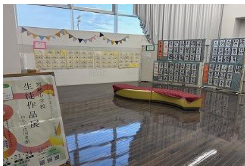
11/22～24 筑穂中学校生徒作品展inちくほ図書館 【ちくほ図書館】