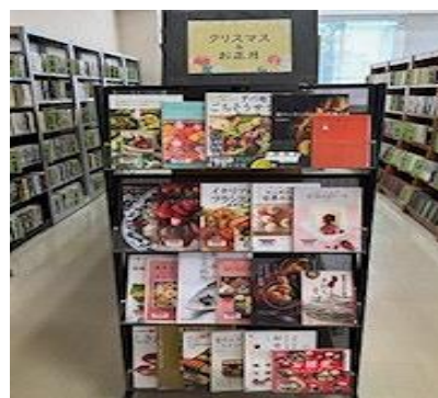
穂波館 12月 『クリスマス & お正月』