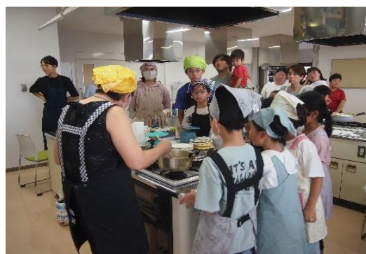
9/29 子育て支援講座②「食育」 【庄内図書館】