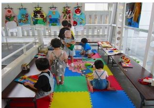
6/22～23 ちくほ図書館まつり 【ちくほ図書館】