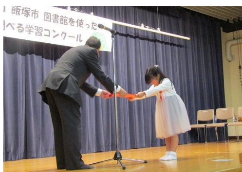
11/2 第7回 飯塚市 図書館を使った 調べる学習コンクール表彰式 【イヅカコミュニティセンター401】