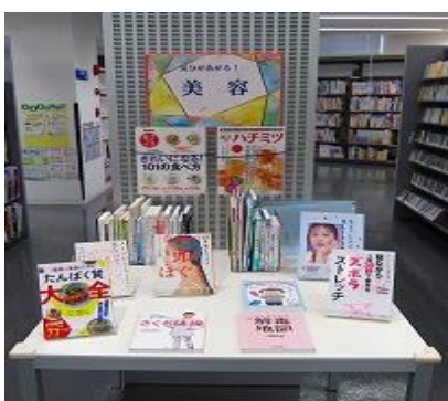
ちくほ館 11月 『気分があがる！美容』