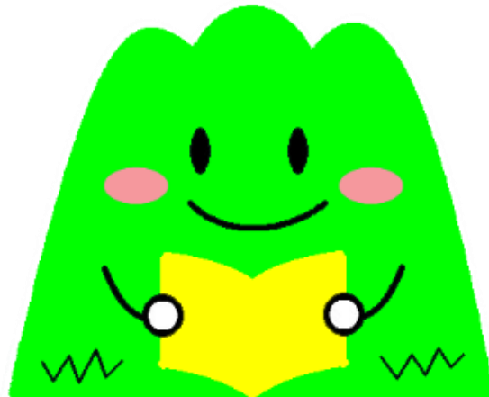
飯塚市立図書館キャラクター 「ぼたぼん」