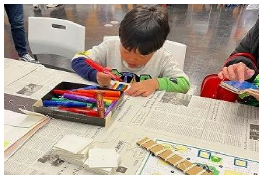
2/8 エコスタいいづか 【飯塚市役所】