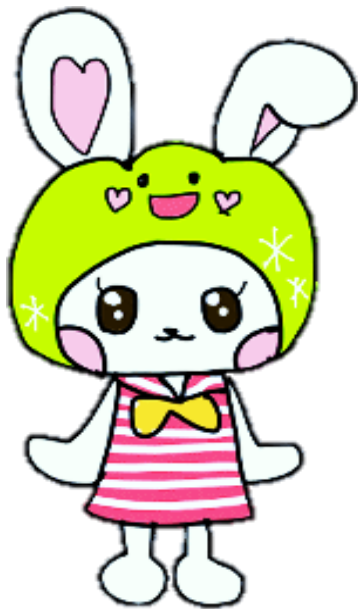
りぶ活teensキャラクター 「ぼたうさ」