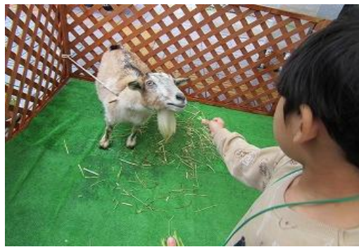
3/15 読書好きを育む環境づくり応援事業 おはなし会とふれあい動物園 【イヅカコミュニティセンター展示ホール】