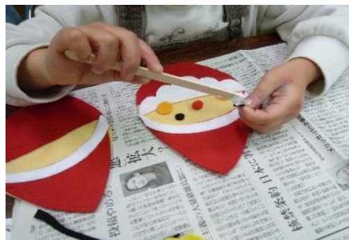
12/15 楽しくつくろう工作教室 【穂波図書館】