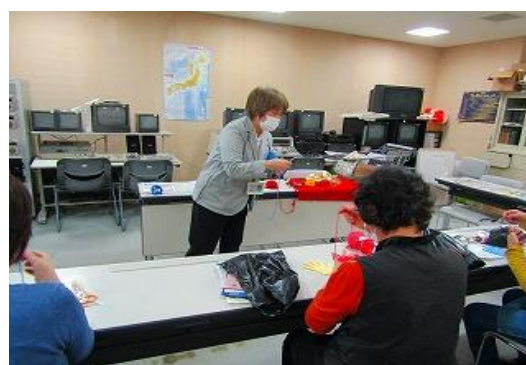
11/7 第22回得する街のゼミナール 【飯塚図書館】