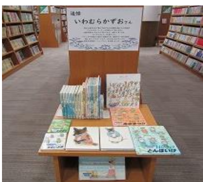
飯塚館 2月 『追悼 いわむらかずおさん』