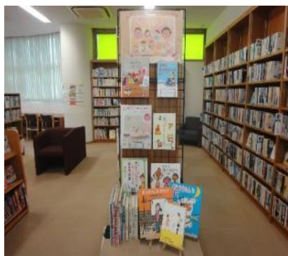
穎田館 5月 『想いを伝えよう』