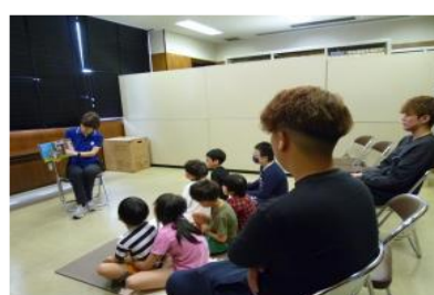
おはなし会【穂波図書館】