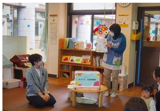
5/16 飯塚市子育て支援センター合同育児講座 「親子DE図書館」 【庄内交流センター・庄内図書館】