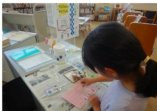
7/2～9/1 子ども読書スタンプラリー 【瀬田図書館】