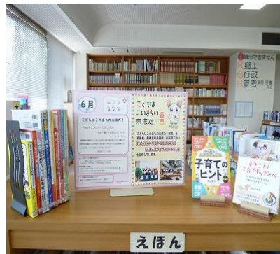
穂波館 6月 『こどもはこのまちの未来だ！』