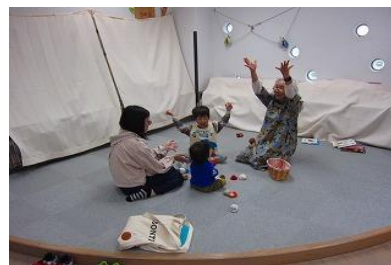
おはなし会【ちくほ図書館】