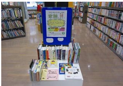
7/19～2/28 読書好きを育む環境づくり応援事業 家読 【ちくほ図書館】