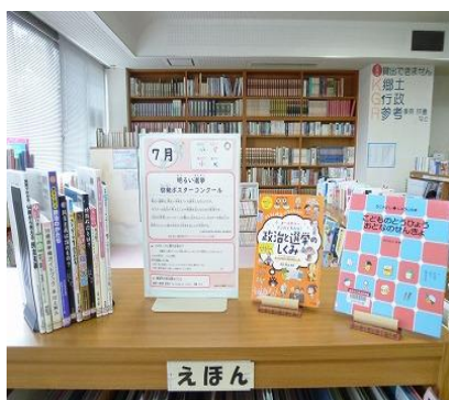
穂波館 7月 『明るい選挙』