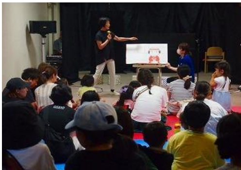
7/6 夏のスペシャルおはなし会 【庄内図書館】