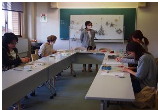
11/6 庄内子育て支援センター協働講座 「ヒンメリ作り」 【庄内図書館】