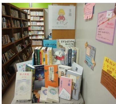
穎田館 1月 『手紙』