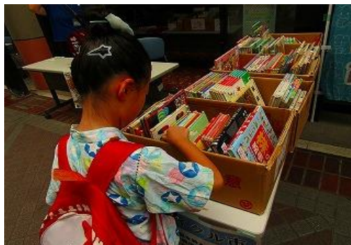
7/20・7/27・8/3 ぶっくりモール 【飯塚図書館・東町商店街】