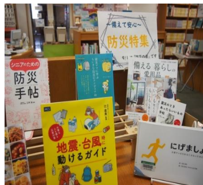
庄内館 9月 『備えて安心 防災特集』