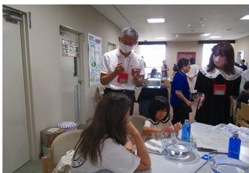
9/14 サイエンスモールin飯塚2024 理科読 【庄内図書館】