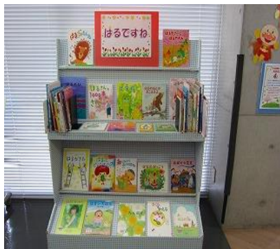
ちくほ館 4月 『はるですね』