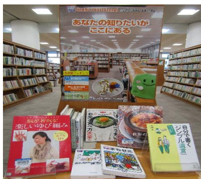
飯塚館 10月 『街ゼミ22』