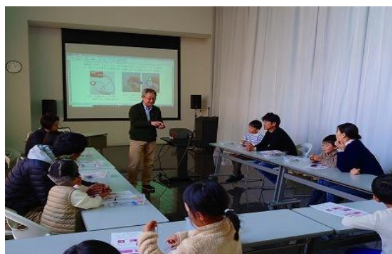
12/7 リフレッシュ理科教室（番外） 【ちくほ図書館】