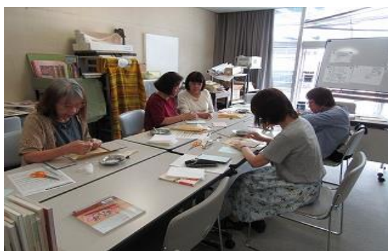
6/12 第12回得する街のゼミナール 【飯塚図書館】