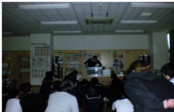
11/7 理科読 【穎田小中一貫校】