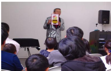
6/15・16 第17回ちくほ図書館まつり 【ちくほ図書館】