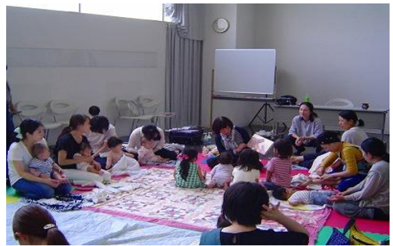
5/23 子育て支援講座① 「あかちゃんと遊ぼうタッチケア」 【ちくほ図書館】