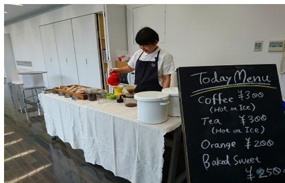
6/15 筑穂庁舎ふれあいCafé協働企画 図書館カフェ 【ちくほ図書館】