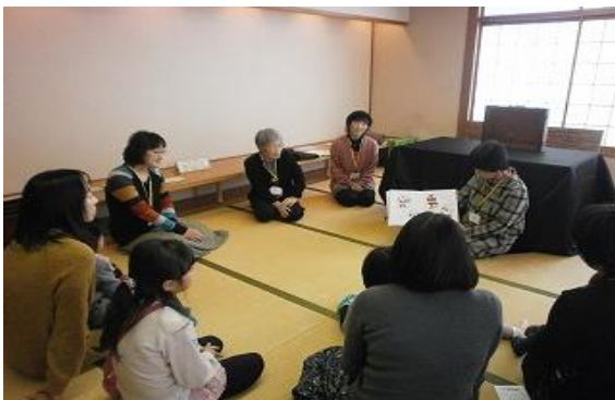
おはなし会【飯塚図書館】