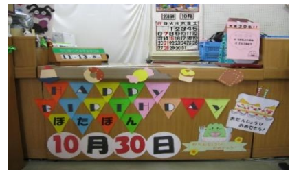
10/30 ぼたぼんお誕生日会 【穂波図書館】