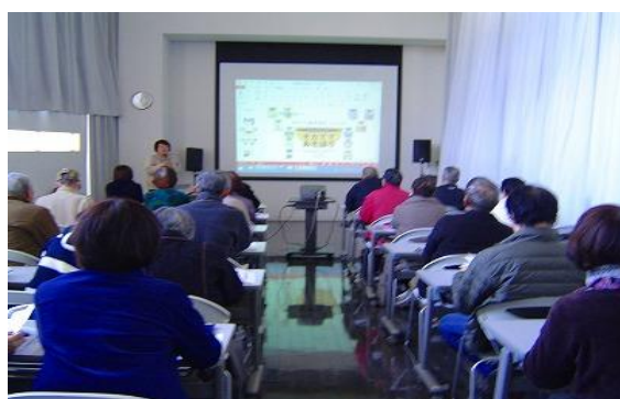
2/19 野菜づくりのコツと裏ワザ (春・夏編) 【ちくほ図書館】