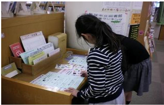
4/12~5/10 子ども読書クイズ大会 【全館】