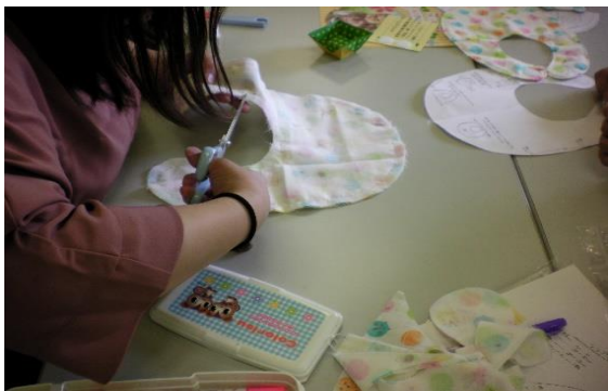
5/24・31 子育て支援講座② 「ベビーグッズ制作講座①②」 【庄内図書館】