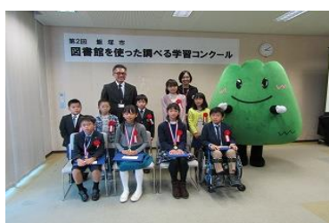
11/24 第2回 飯塚市図書館を使った 調べる学習コンクール表彰式 【イヅカコミュニティセンター-301・302】