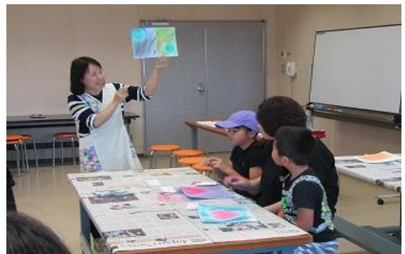
6/23 子育て支援講座③ 「親子で楽しむカラーセラピー」 【イツ コミュニティセンター-工芸工作室】