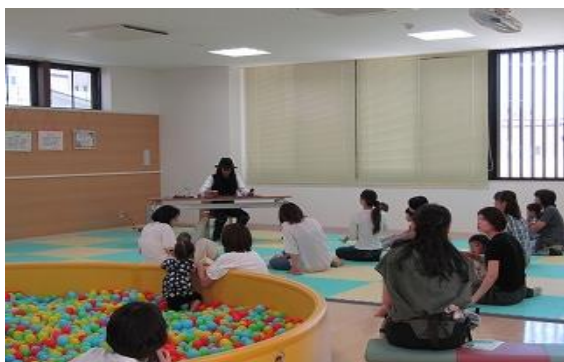
6/13 本のソムリエ 団長さん講演会 【街なか子育てひろば】