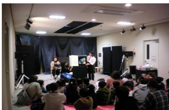
12/7 おはなし宅配便2019 【庄内図書館】