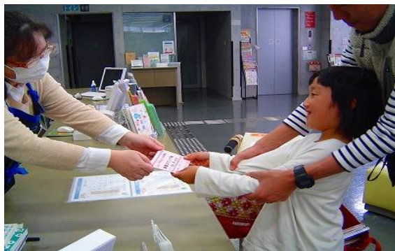
4/12~3/31 読書スタンプ帳 【ちくほ図書館】