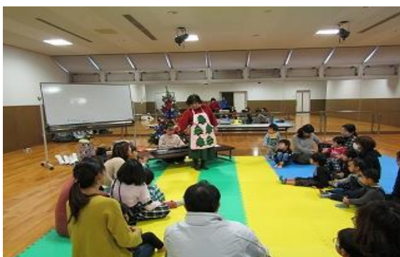
12/22 子育て支援講座⑥ 「音楽遊び」 【イツ コミュニティセンター-軽運動室】