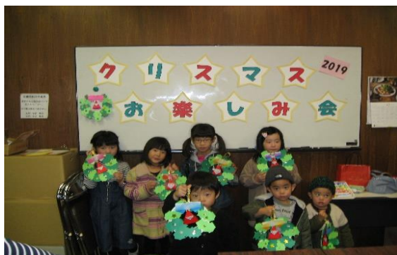
12/21 クリスマスお楽しみ会 【穂波図書館】