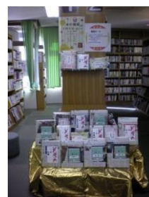
1/5～13 本の福袋 【庄内図書館】