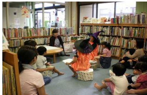
おはなし会【庄内図書館】