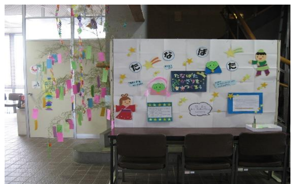
7/2~7/7 七夕まつり 【穂波図書館】