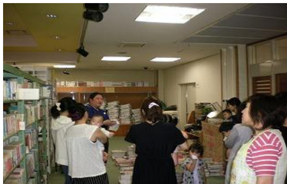
6/6 飯塚市子育て支援センター合同育児講座 「親子DE図書館」 【庄内交流センター別館、庄内図書館】