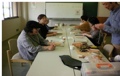
10/25～27 庄内図書館まつり 【庄内図書館】