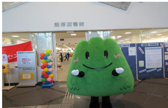
11/15~17 ぶっくりモール 【飯塚図書館、イヅ コミュニティセンター、 本町・東町商店街】