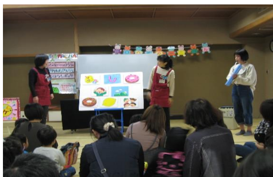
11/23 ほなみBOOKカーニバル 【穂波交流センター和室】