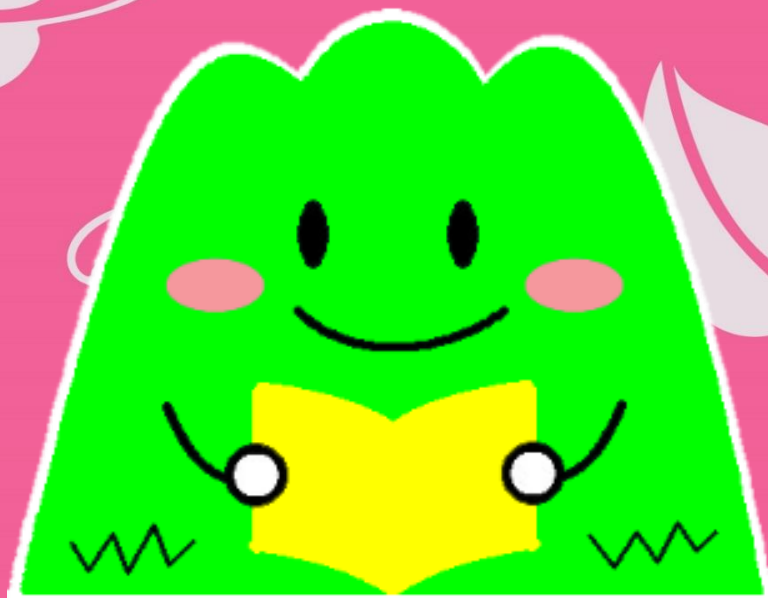
飯塚市立図書館キャラクター 「ぼたぼん」