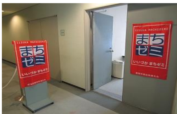
6/12 第12回得する街のゼミナール 【飯塚図書館】