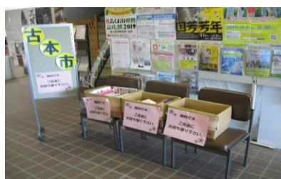
11/23 古本市 【穂波図書館】