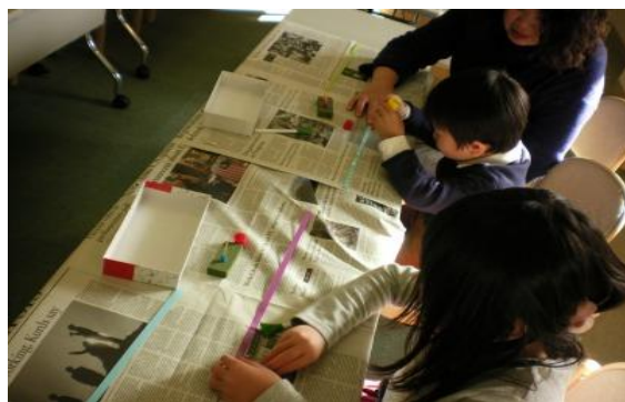
1/5 こま作り 【庄内図書館】