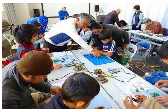
12/8 電波教室～ラジオ工作～ 【ちくほ図書館】