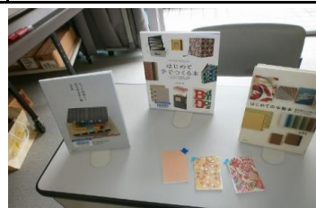
10/22 第14回得する街のゼミナール 【飯塚図書館】