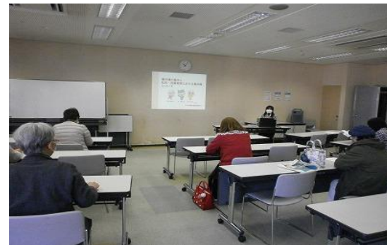
3/11 ボランティアスキルアップ講座 【イツ コミュニティセンター-301・302】