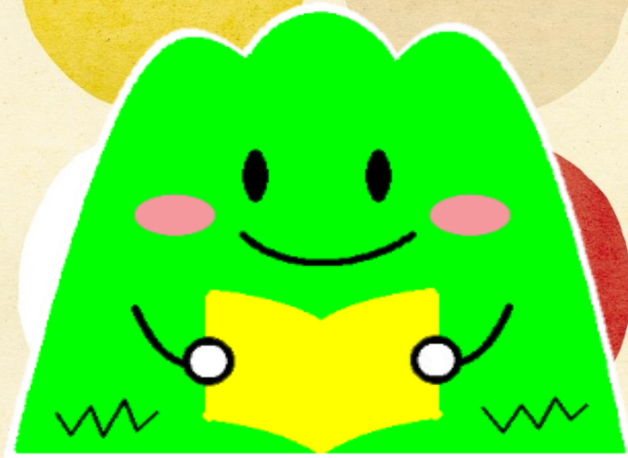
飯塚市立図書館キャラクター 「ぼたぼん」