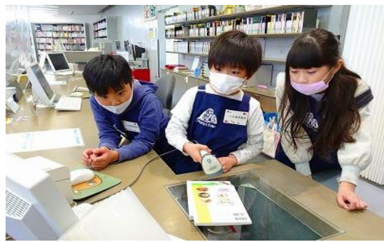
3/25・26・30・31 一日図書館職員体験 【飯塚・ちくほ・庄内・穂波図書館】