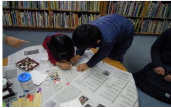
1/10 こま作り 【庄内図書館】