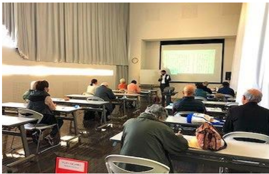
3/3 郷土を学ぼう講座 「ふるさとの民話・昔話に学ぶ ～嘉穂地方を中心に～」 【ちくほ図書館】