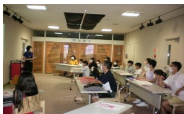
7/19,8/23 サポート教室 【庄内図書館】