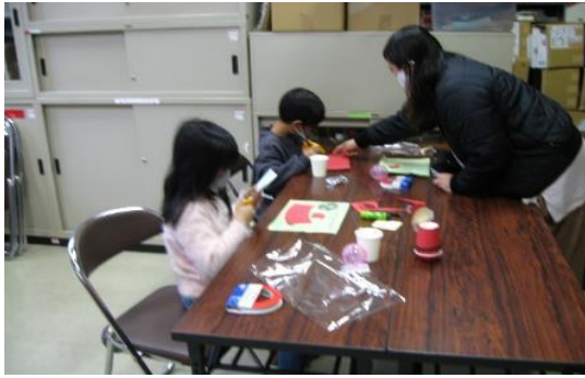
12/20 クリスマスお楽しみ会 【穂波図書館】