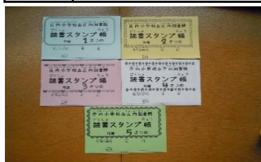
4/10～3/31 読書スタンプ帳 【庄内図書館】