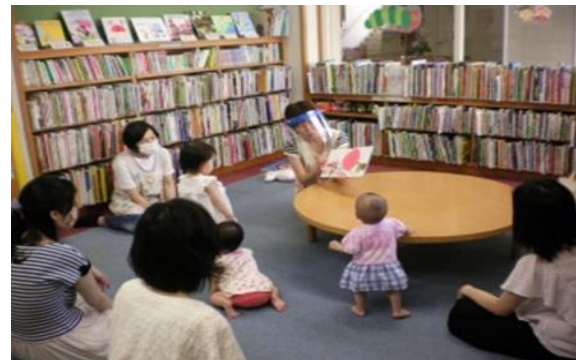
おはなし会【庄内図書館】