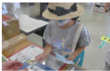
7/17～8/31 夏の子ども読書スタンプラリー 【穂波図書館】