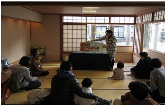
おはなし会【飯塚図書館】

*1 集団健診中止のため、図書館にて実施 健診案内に同封及びフライヤーやポスター、ハガキ等で呼びかけ