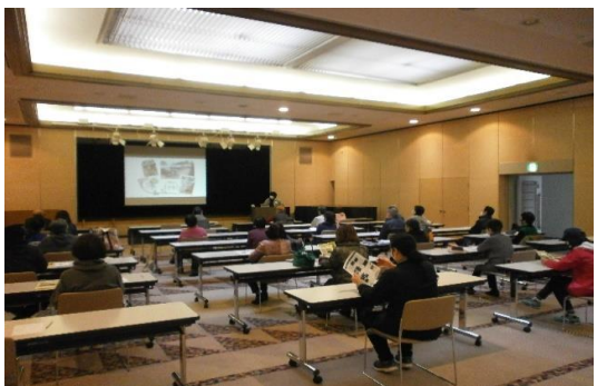
3/13 野菜づくりのコツと裏ワザ（春・夏編） 【イツ コミュニティセンター-401】