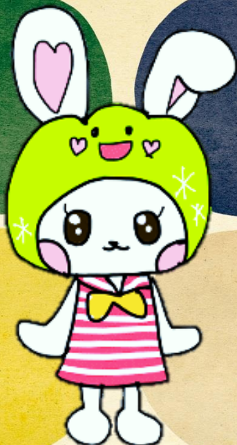
りぶ活teensキャラクター 「ぼたうさ」