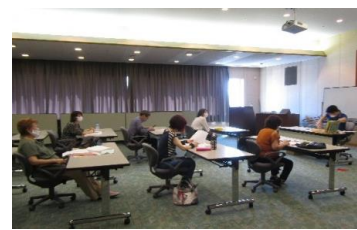
8/18・29 図書館ボランティア養成講座 【飯塚図書館】