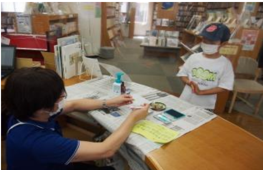
7/20~8/31 夏の子ども読書スタンプラリー 【庄内図書館】