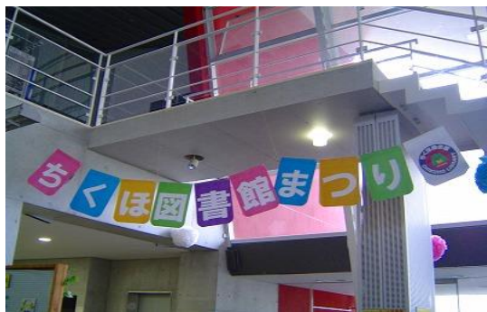
6/11・12 ちくほ図書館まつり 【ちくほ図書館】