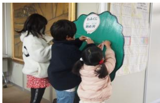
1/5~12 本とおみくじ 【庄内図書館】