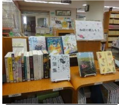
庄内館 5月 『和歌に親しもう』