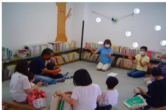
おはなし会【ちくほ図書館】