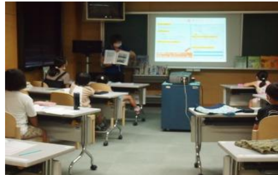
7/24,8/6 第5回 飯塚市 図書館を使った 調べる学習コンクール サポート教室