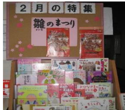
穂波館 2月 『雛のまつり』