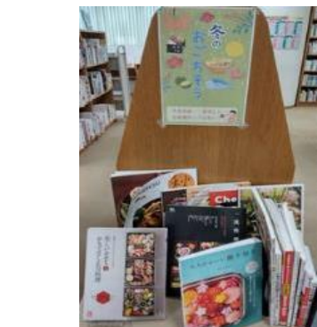
穎田館 12月 『年末年始ごちそう作ろう』