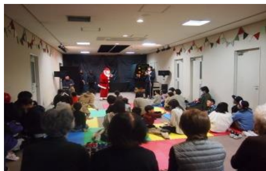
12/17 おはなし宅配便2022 【庄内図書館】