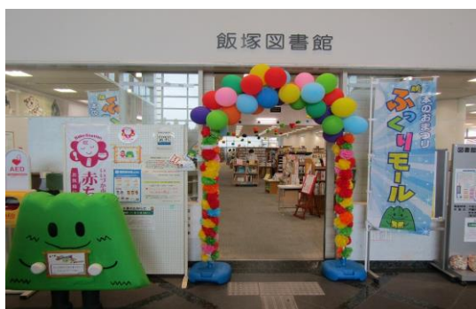
11/18~11/20 ぶっくりモール 【飯塚図書館】