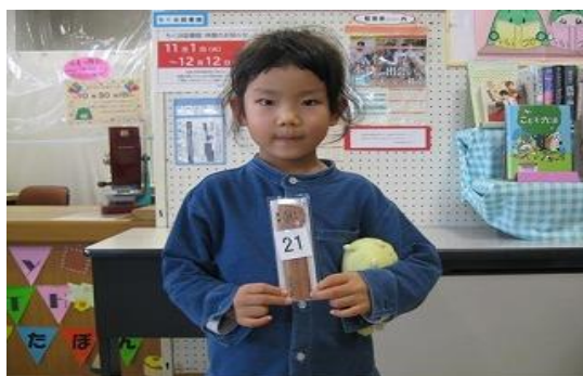
10/30 ぼたぼんお誕生会 【穂波図書館】