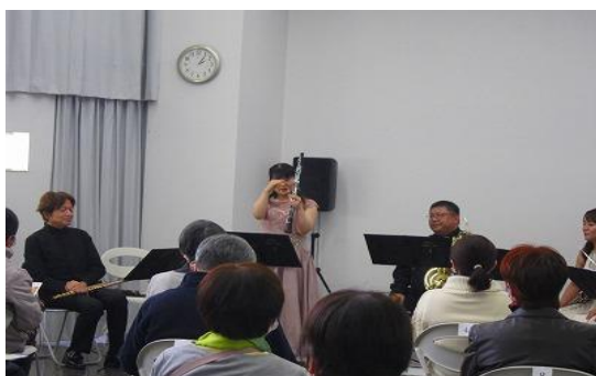
1/15 イズ カミュニティセンター出前コンサートvol. 45 ゲラルガード 木管五重奏団inちくほ図書館 【ちくほ図書館】