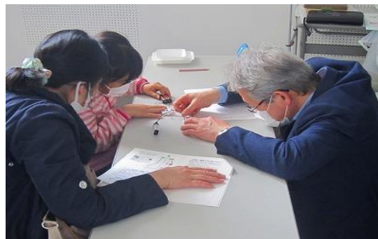
3/25 リフレッシュ理科教室(番外) 【ちくほ図書館】