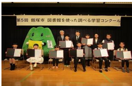
11/6 第5回 飯塚市 図書館を使った調べる 学習コンクール表彰式 【イヅカコミュニティセンター401】