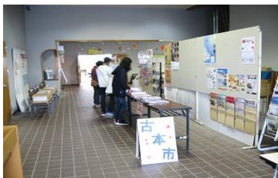
12/3・4 古本市 【穂波図書館】