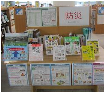
飯塚館 7月 『防災』