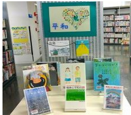
ちくほ館 8月 『平和』