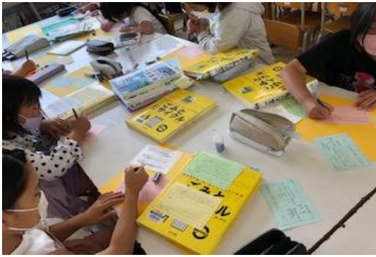
7/13 第5回 飯塚市 図書館を使った 調べる学習コンクール/出前授業 【鯉田小学校】