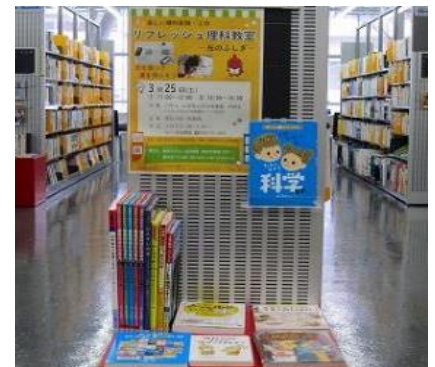
ちくほ館 3月 『科学』