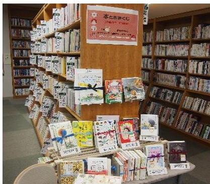
庄内館 1月 『本とおみくじ』