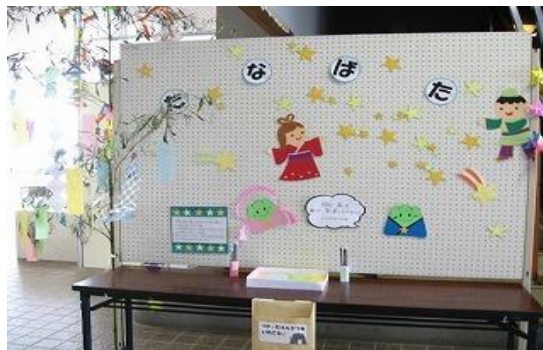
6/29~7/10 七夕まつり 【穂波図書館】