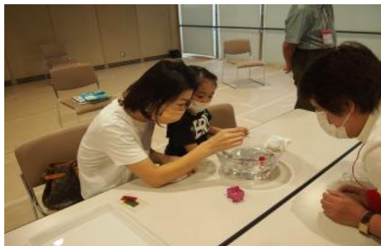
9/17 サイエンスモールin飯塚2022 第9回 理科読 【イズ カミュニティセンター音楽室】