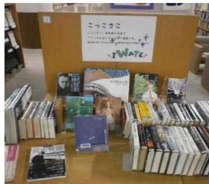
飯塚館 11月 『こっこさこ』