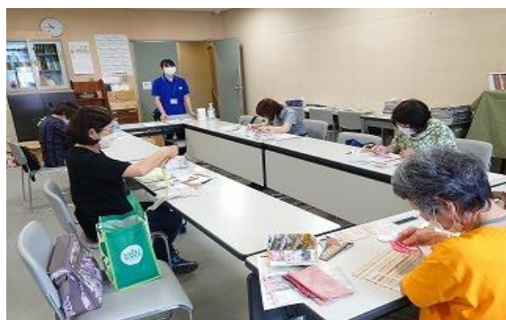
5/26 第17回 得する街のゼミナール 【飯塚図書館】