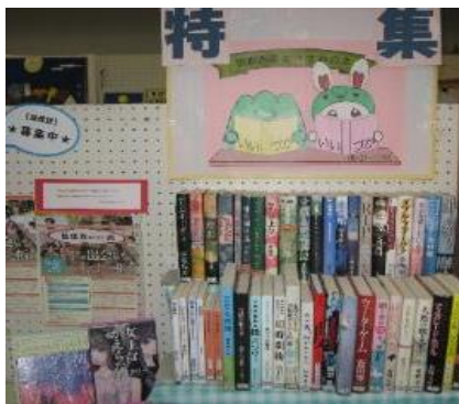
穂波館 10月 『読書週間 おすすめの本』