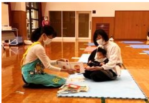
ぴよぴよ相談 【穂波保健福祉総合センター】

*ぴよぴよ相談＝生後4か月児を対象とした育児相談で市内2ヶ所にて毎月各1回実施(子育て支援課)