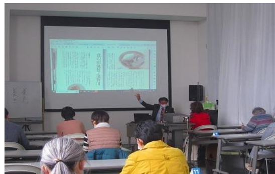
3/1 郷土を学ぼう講座 【ちくほ図書館】