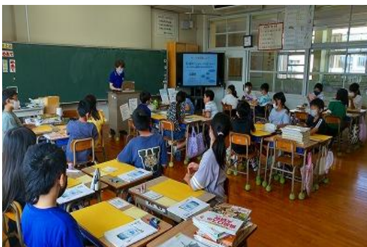
10/14 第5回 飯塚市 図書館を使った 調べる学習コンクール/出前授業 【若菜小学校】