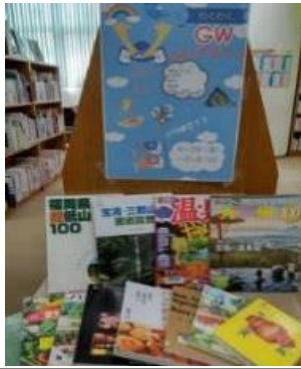
穎田館 4月 『ゴールデンウィーク何する?』