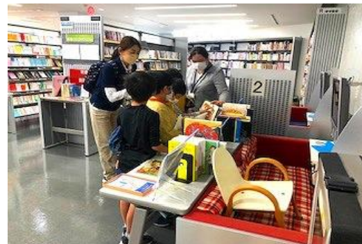
10/28 ちくほ図書館見学 【内野小学校】