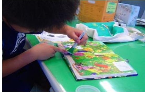
7/26~29 一日図書館職員体験 【ちくほ図書館】