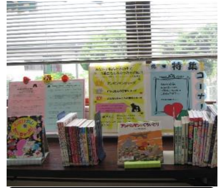
穂波館 6月 『【子ども読書クイズ大会】 あなたが一番おもしろかった本』