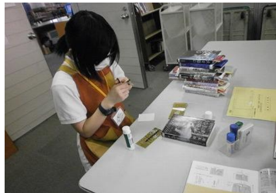
9/27~10/1 インターンシップ(就業体験) 【飯塚図書館】