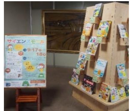
庄内館 9月 『サイエンスの本』