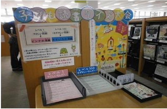
4/15~5/13 子ども読書クイズ大会 【飯塚図書館】