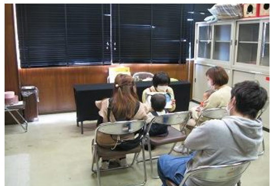
おはなし会【穂波図書館】