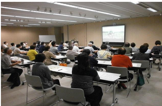
10/2 野菜づくりのコツと裏ワザ講座 【飯塚図書館】