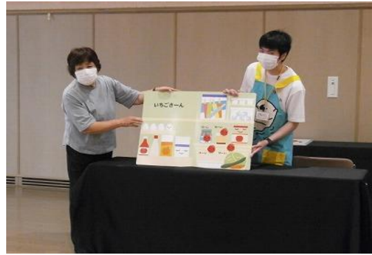
8/4・5 インターンシップ(就業体験) 【飯塚図書館】