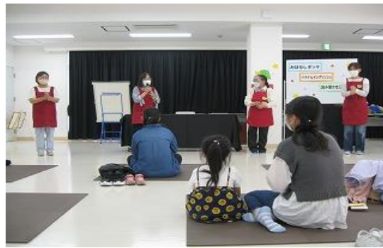
10/22 ほなみBOOKカーニバル 【穂波図書館】