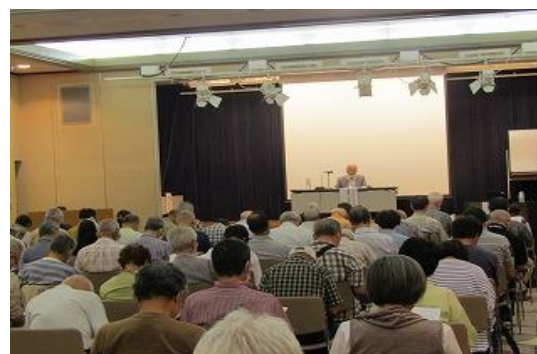
5/29~2/11 遠賀川古代史事業 【イヅカコミュニティセンター401等】